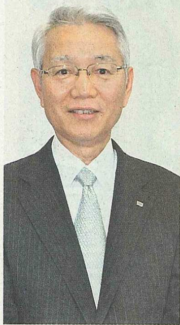
リコーリース社長